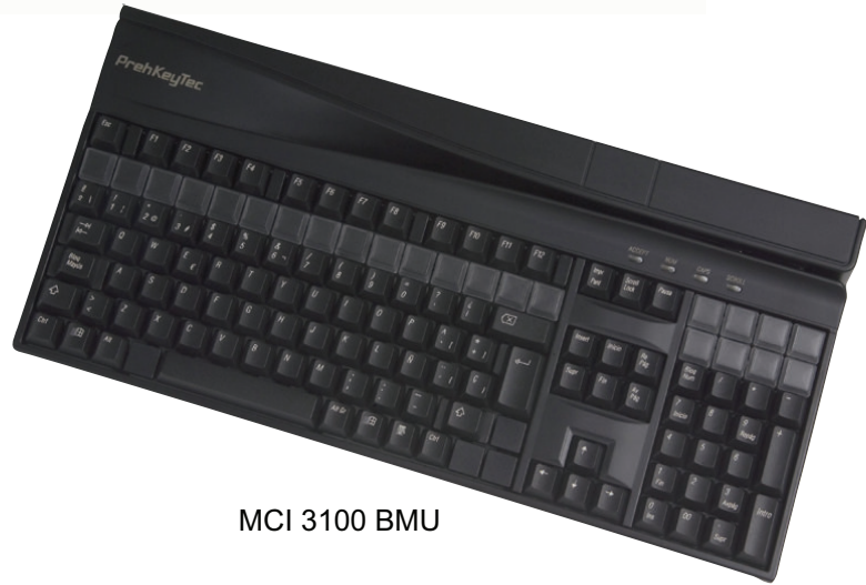
MCI 3100 BMU